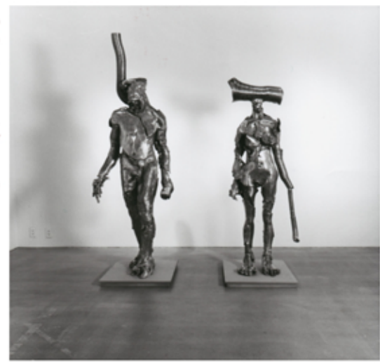
Adam / Eve