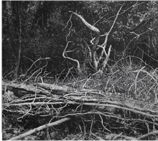
Pineta di Migliarino, Massaciuccoli